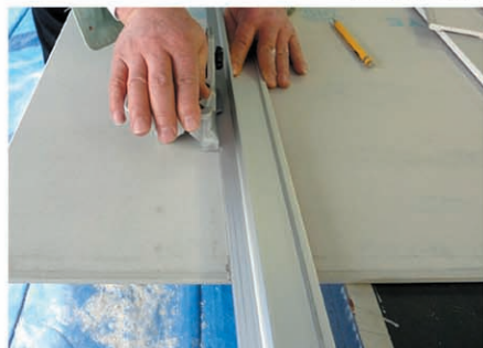
(イ)スクライブ(切欠き入れ) 写真 (セットホルダー)