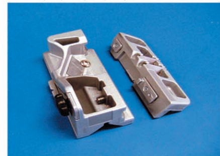
(左)本体ホルダー(右)端面仕上げホルダー 簡単組み立てセットホルダー①となります。