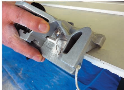
(ニ)コーナー面取り加工写真 (本体ホルダー)単体重量400g