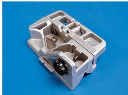
① セットホルダー製品全体写真 形式SB-103-00