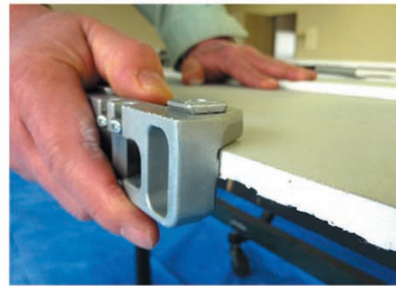
(ハ)端面凸凹部仕上げヤスリ加工写真 (端面仕上げホルダー)単体重量190g