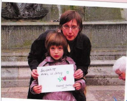
日本と心をひとつに カリヌ・ダニエル（ナント市助役）