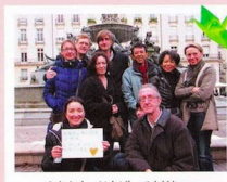
みなさん、がんばってください。 にほん、まいにちにかんがえています。♥