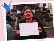
みなさん がんばってください。 日本まいにちにかんがえています。