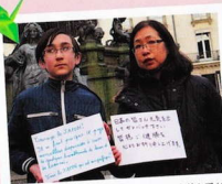
がんばれ日本!地震や津波なんかでこんな素敵な国が なくなってしまうなんて。万歳、素晴らしい日本!!!