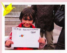
ぼくはにほんのことをたくさんもっています。