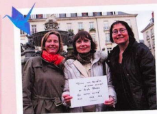
私たちの思いと支援を日本の皆様へ。私たちの 友情が皆様の元へ飛び立ち、届きますように。