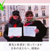
勇気と希望を! 祈っています 日本への友へ、頑張れ