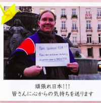
頑張れ日本!!! 皆さんに心からの気持ちを伝えます