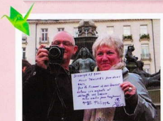
数えきれないほどの思いを友人である皆様。 私たちが打った嵐渦のあかりがみなさまの心を照らし、 再び温められますように。変わらぬ友情を皆様へ。