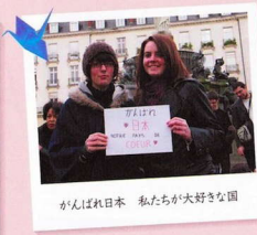
がんばれ日本 私たちが大好きな国