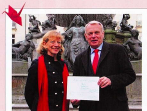
日本の友人諸君へ 友情、連帯、友愛 ジャン＝マルク・エロー（ナント市長）

この他AJ協会では、レンズ市仙台市の姉妹都市委員会を応援し、ナント市でのCANDLE NIGHTに参加、4月は千羽鶴のアリエで募金したり、5月29日、チャリティコンサートも行いました。