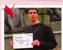
新潟・ナント 日本は僕の心のなかに