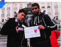
距離は遠いけれど、♥は皆さんの側に