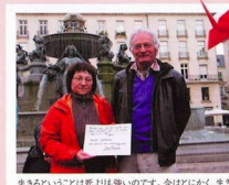
生きるという事は死よりも強いのです。今はとにかく、生きて いきましょう。共に繋がって。どこの国の人間であらうと。 友情と連帯を。私たちの心は皆さんと共に。