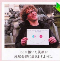
ここに描いた笑顔が 地球全部に届きますように。