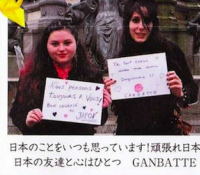
日本のことをいつも思っています! 頑張れ日本 日本の友達と心はひとつ GANBATTE