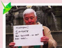
Minasan ! ganbate がんばれば、みなさんと共にいますよ。