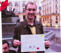
日本 皆さんと心はひとつに