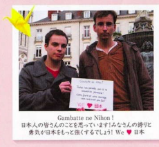
Gambatte ne Nihon! 日本人の皆さんのことを思っていますみなさんの誇りと 勇気が日本をもっと強くしましょう! We ♥ 日本