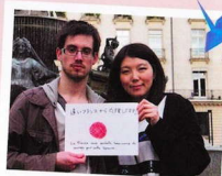
フランスは、皆さんがこの試験に立ち向かう 勇気を持てるよう願っています。