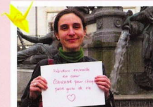
一緒にがんばりましょう / 心(ハート)形になって / 生きるための小さな事ごとひとつひとつに気力を持って