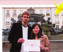
日本の皆さんへ 世界中の人が 応援してくれています。日本はきっと大丈夫!!